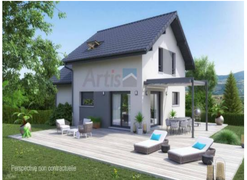
Perspective non contractuelle